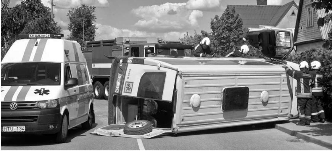
Avariją patyręs Anykščių Antano Vienuolio progimnazijos mokyklinis autobusas, tikėtina, bus pripažintas neremontuotinu.

Trečiadienį, gegužės 24-ąją, apie 15 valandą, Anykščiuose, tradicinėje avarijų vietoje – Taikos ir V. Kudirkos gatvių sankryžoje – iš šalutinio kelio išvažiavęs krovininis mikroautobusas trenkėsi į pagrindiniu keliu važiuosį Anykščių Antano Vienuolio progimnazijos autobusą. Po smūgio mokyklinis autobusas virto ant šono ir 20–30 metrų slydo asfaltu.