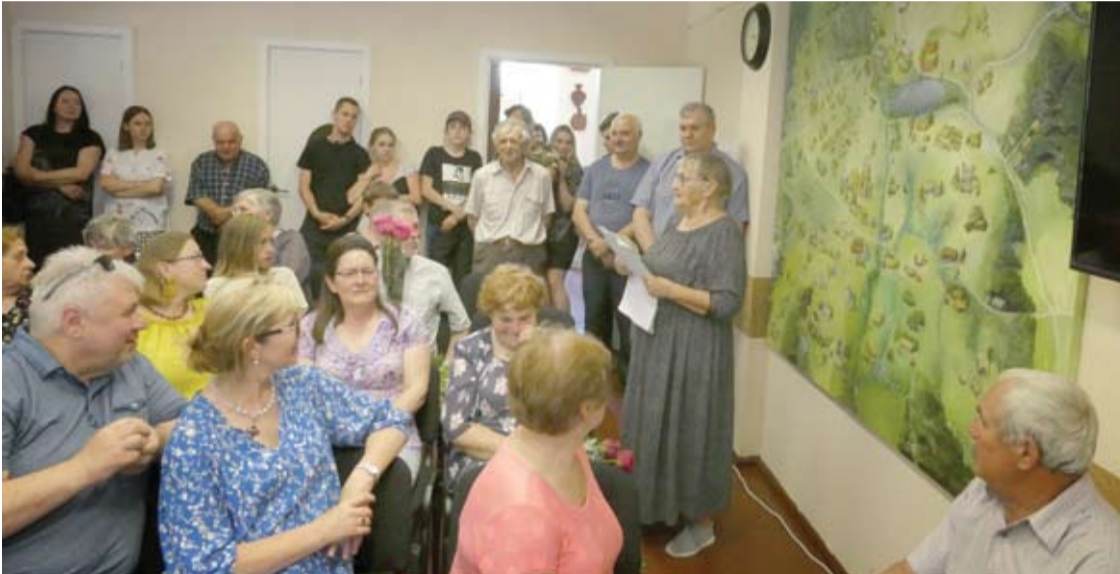
Tapyba ant didelio formato drobės pareikalavo daug laiko, bet rezultatu džiaugiasi dabartiniai kaimų gyventojai, didžiulis ir būsimos kartos.