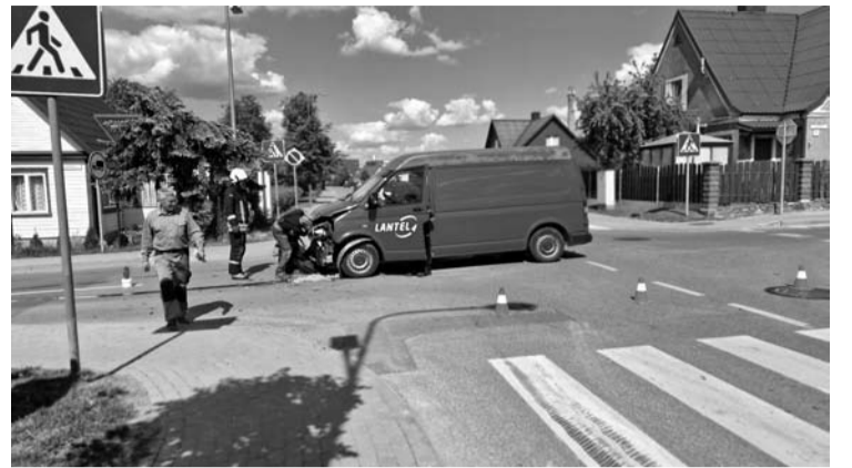
Avarijos kaltininkas, krovininio mikroautobuso vairuotojas sakė žinojęs, kad važiuoja šalutiniu keliu, o kodėl nepraleido pagrindiniu keliu važiuosio autobuso, jis paaiškinti negalėjo.