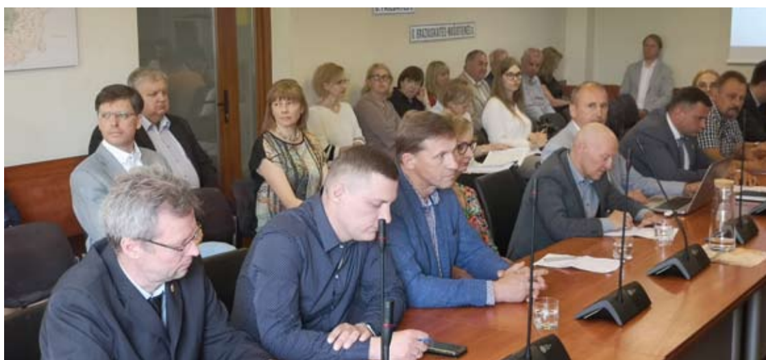
„Valstiečiai“ pasiskelbė penktąją opozicinę frakciją. Toks jų žingsnis nustebino anksčiau opozinėmis pasiskelbusių frakcijų narius.

Robertas ALEKSIEJŪNAS robertas.a@anyksta.lt