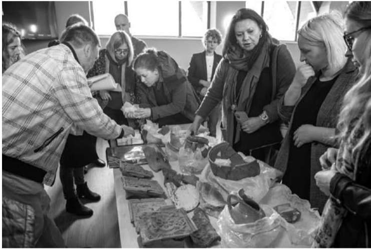
Anykščių menų inkubatoriuje-menų centre pirmą kartą lankėsi Nacionalinio muziejaus Lietuvos Didžiosios Kunigaikštystės valdovų rūmų specialistai, kurie domėjosi Anykščių dvarvietėje rastais archeologiniais radiniais.

Praėjusią savaitę, Tarptautinę muziejų dieną, Anykščiuose lankėsi Nacionalinio muziejaus Lietuvos Didžiosios Kunigaikštystės valdovų rūmų specialistai. Jie apžiūrėjo Anykščių dvarvietės archeologinius radinius ir siūlė, kaip juos būtų galima eksponuoti Anykščių menų inkubatoriuje-menų studijoje.